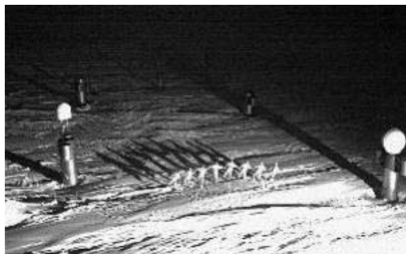
Der Walpurgistanz