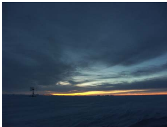
Der Windwilli in der Dämmerung. Es ist 9h00, zwei Stunden vor Sonnenaufgang