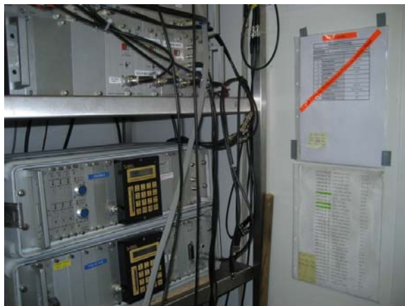
Die Seismik-Datenerfassung