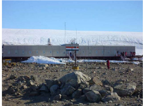
Station Maitri

Später wandern wir zur indischen Station Maitri. Wir traversieren dabei Geröllfelder, die anmuten wie eine Mondlandschaft, doch ab und zu fliegen Vögel vorbei und beäugen uns neugierig. Auf Maitri werden wir rührend empfangen und umsorgt. Uns wird ein wundervolles Mittagessen serviert – die Stationsbesatzung teilt sogar die ersten frischen Trauben seit Monaten mit uns. Tief beeindruckt von dieser Gastfreundschaft verabschieden wir uns und treten den Rückweg nach Novo Airfield an.