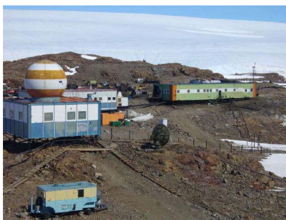
Station Novolazarevskaja

Den ersten Tag verbringen wir vor allem mit Schlafen und Warten. Aufgeregt unternehmen wir aber auch kleinere Spaziergänge – unsere erste Kontaktaufnahme mit der Antarktis! Die gemeinsamen Mahlzeiten im Zelt, das Zähneputzen oder das Aufsuchen des Plumpsklos sind sehr amüsante Ereignisse. Und besonders abenteuerlich ist das Einschlafen: Die Zeltwände werden immer mal wieder vom starken Wind durchgeschüttelt – und die Sonne geht nie unter... Am zweiten Tag machen wir uns mit einem russischen Raupenpanzer – rumpelnd – auf den Weg zur russischen Station Novolazarevskaja. Sie ist auf Fels gebaut und befindet sich unterhalb der antarktischen Hochebene, einige wenige Kilometer von Novo Airfield entfernt.