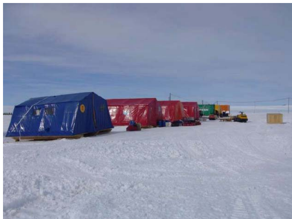
Zeltlager Novo Airfield

Draussen umarmen wir uns vor Freude... Schliesslich helfen wir mit, die Illjuschin zu entladen und frühstücken dann im grossen Lagerzelt von Novo Airfield. Das Wetter auf Neumayer ist schlecht und so bleiben wir hier für zwei Tage sitzen. Uns werden zwei Zelte mit je acht Campingliegen zugeteilt.